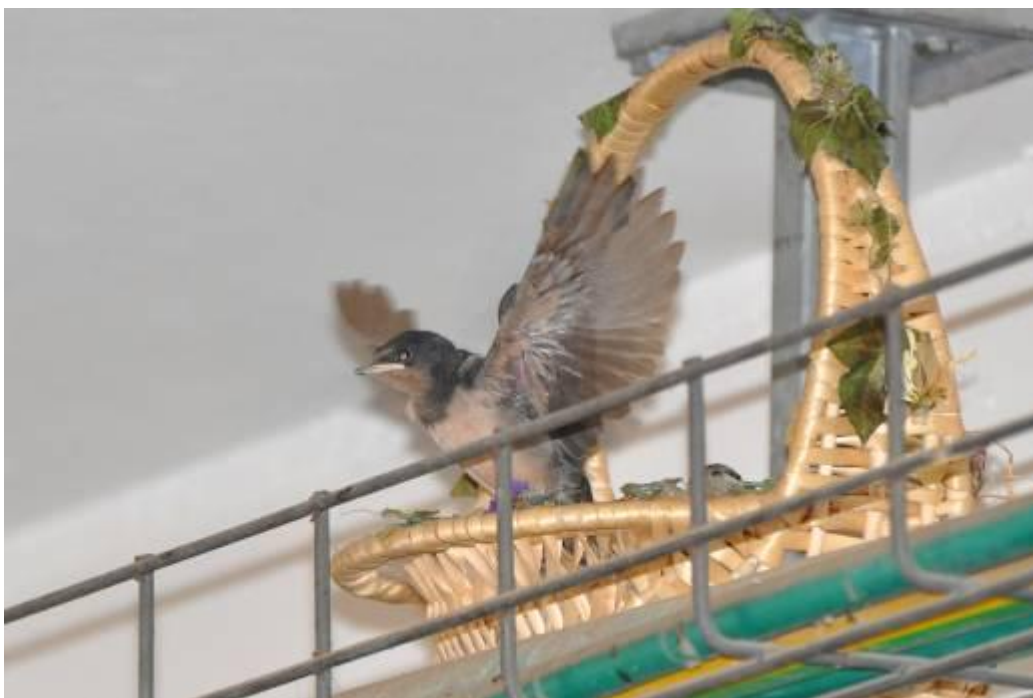
לאחר יום – הגוזלים מותחים כנפיים לקראת אימוני התעופה