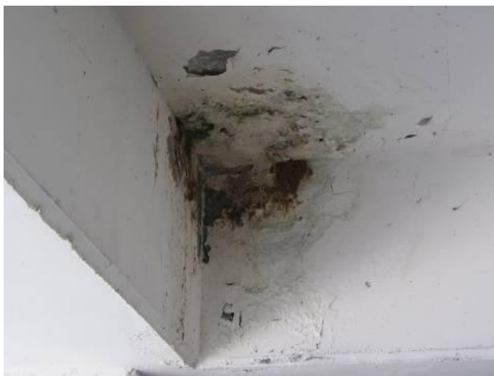
למעלה: שרידי הקן ההרוס על הקיר שנרטב למטה: יובל ונועם בוחנים את הגוזלים מקרוב