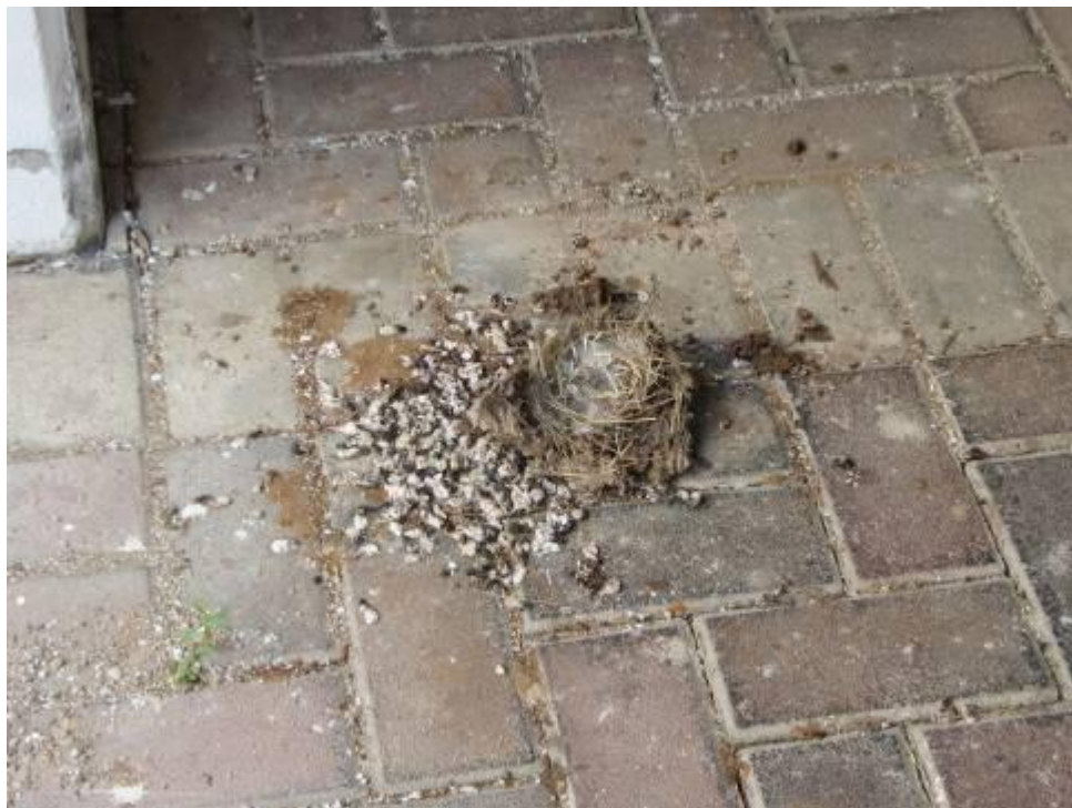
שרידי הקן שנפל