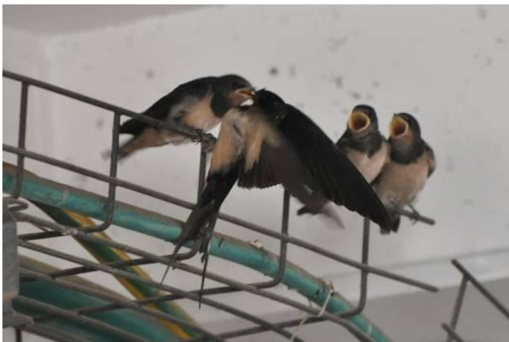
לאחר יום נוסף – הגוזלים כבר מתרחקים מהקן

בימים הקרובים צפויים הגוזלים לפרוח מהקן ובקרוב יעשו את מסעם הארוך חזרה מישראל לדרום אפריקה, וישבו באביב לארצנו.