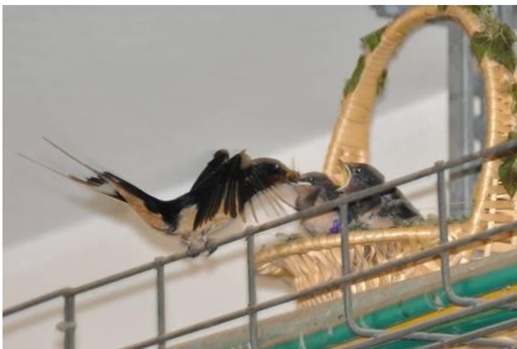
ארוחה ראשונה (דבורה) מובאת אל הקן החדש