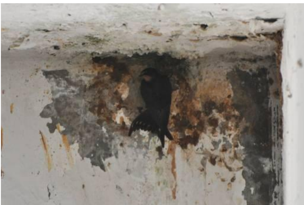
אחיהם הבוגרים של הגוזלים, ממחזור הקיבון הראשון, בוחנים את אזור הקן שנפל