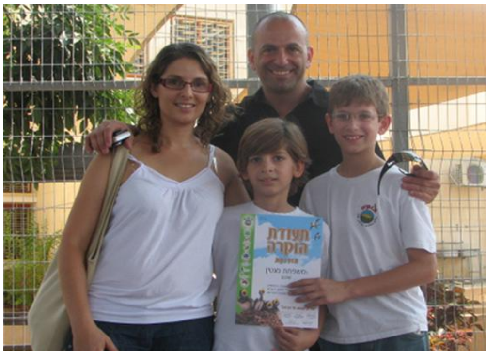
משפחת מנטין ותעודת ההוקרה שקיבלה