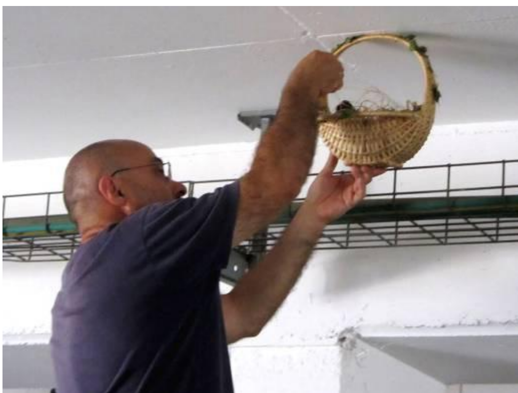
"הקן" החדש מונח בסמוך למקום הקן שנהרס

ילדי משפחת מנטין המשיכו לעקוב בדאגה אחר הגוזלים גם בימים הבאים ולשמחתם נוכחו לדעת שהורי הציפורים אכן מאכילים אותם ושהם גדלים ומתפתחים