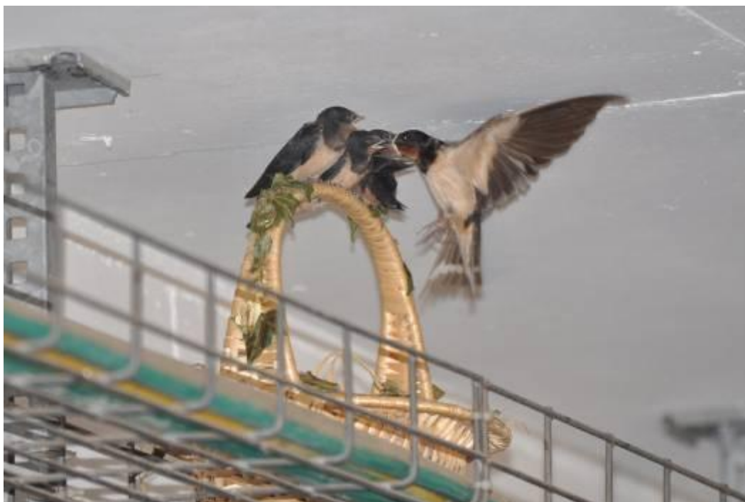
שלושת הגוזלים מעיזים ועולים ל"דירת הגג" וזוכים שם להאכלות תכופות