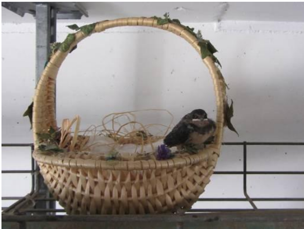
הגוזלים מתאקלמים בביתם החדש