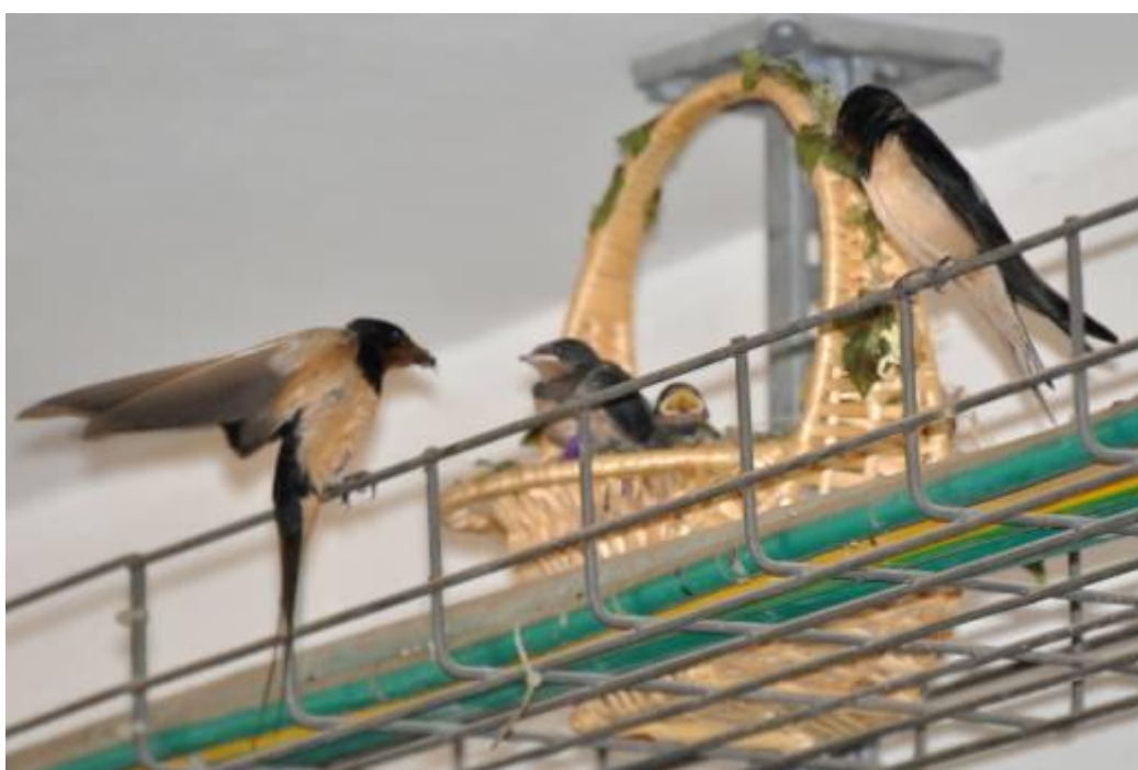
הורי הגוזלים בוחנים בחשדנות את הקן המאולתר

יובל ונעם כתבו מכתבי הסבר לשכנים וביקשו מהם שלא להתקרב אל הגוזלים בקינם המאולתר. את המכתבים תלו בסמוך לאזור הקינון ועל לוח המודעות בכניסת הבניין.