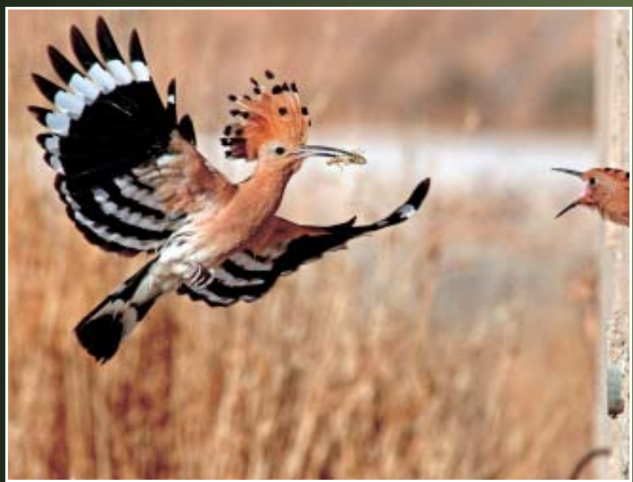
דוכיפת מאכילה בעקרב את גולה בקן במשאבי שדה.

המבצע לווה בפעילות הסברתית וחינוכית יוצאת דופן, אשר נדמה כי כל המדינה על מגזריה השונים נסחפה בקסמה. לכאורה, נראה כי הייתה היסחפות והתלהבות יתר בקידום נושא כביכול משני, על פני ענייניה הבעורים יותר של המדינה. אך הנה, ואולי לא במקרה, ההיענות וההירתמות של הציבור על כל גווניו (כולל החרדים והמגזר הערבי) לבחירת הציפור הלאומית חצתה את כל הגבולות. נראה כי נוצר קונצנזוס ציבורי, שהציפורים המסמלות את החופש וחוסר הגבולות עשויות לקרב וללכד את כולנו, אולי יותר מדברים רבים שנראים לכאורה חשובים יותר. נשיא המדינה - מר שמעון פרס, הציע לארח את אירוע הסיום החגיגי לבחירתה של הציפור הלאומית בטקס ממלכתי במשכנו. בשיאו של האירוע הסיר הנשיא את הלוט מעל צילום הדוכיפת, שנבחרה באופן דמוקרטי כציפור הלאומית של ישראל.