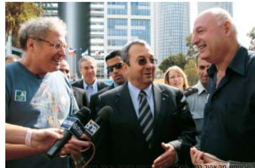
המכירה הקדם צבאית במעגן מיכאל, וידיו מן השירות בסירת מטכ"ל.