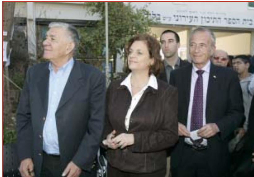
שרת החינוך פרופ' יולי תמיר, ב"בחירות המדגם" בבית ספר בליך, עם תלמידי מפלגת הנשר.