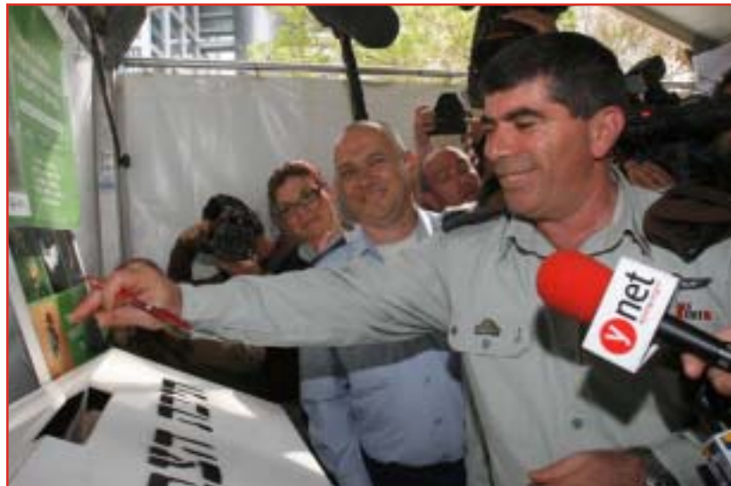
הרמטכ"ל, רב אלוף גבי אשכנזי, מצביע בקריה. מאחוריו קצין חינוך ראשי. הרמטכ"ל בחר בדוכיפת.