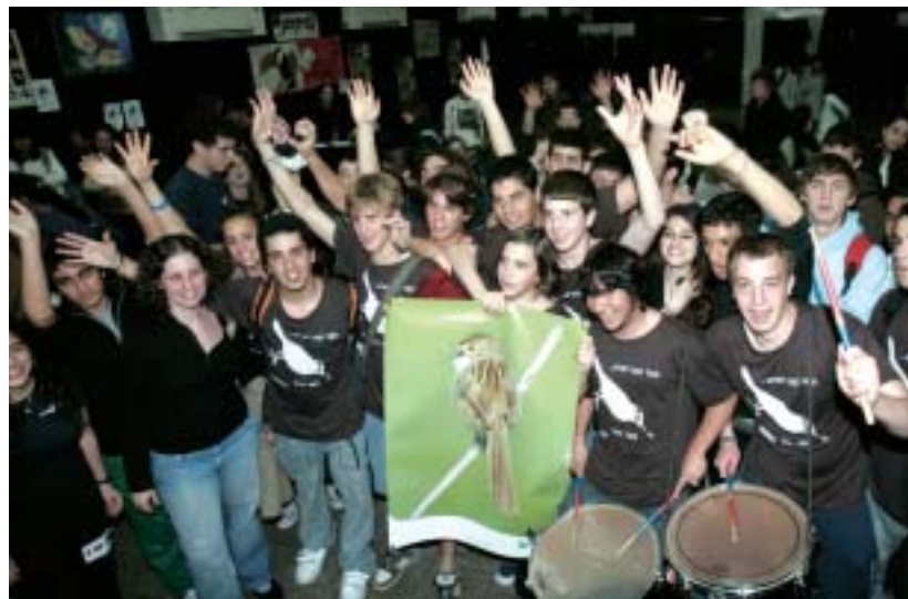
מפלגת הפשוש חוגגת את ניצחונה במדגם שהתקיים בבית ספר בליך, רמת גן.

גם אם היא רחוקה. בהקשר זה הוא ציטט בעגה אשכנזית מודגשת את מילות השיר של חיים נחמן ביאליק "אל הציפור".