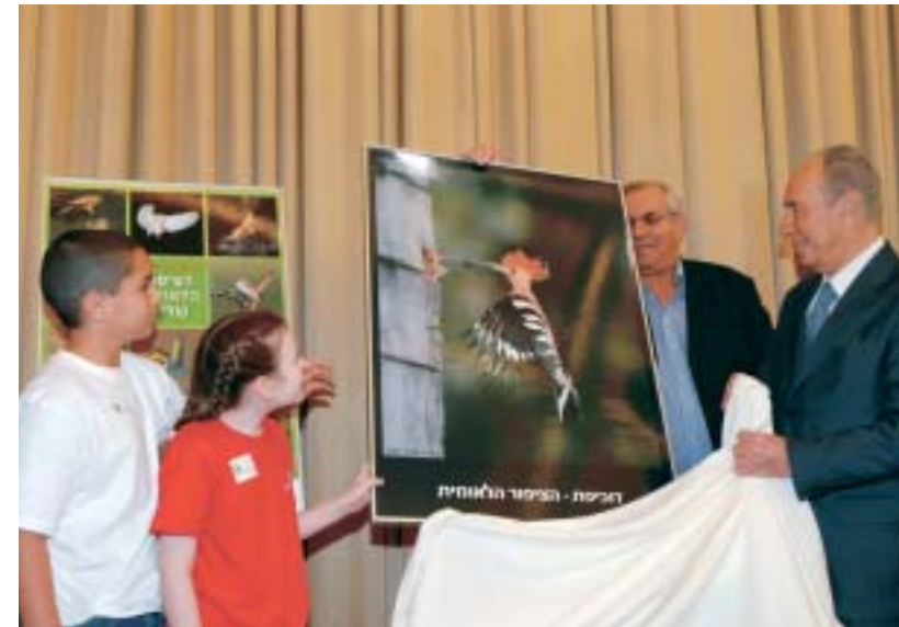
הדוכיפת הוכרזה בטקס ממלכתי בבית הנשיא, הנשיא, מר שמעון פרס, מסיר את הלוט מתמונת הציפור הנבחרת, יחד עם שני תלמידים.

הנשיא התחייב לסייע ולקדם ככל האפשר את נושא הצפרות, ולתמוך במיזמים לשימור הציפורים העומדות בפני סכנת הכחדה בישראל, בדגש על ארבעת אוכלי הפגרים: הנשר, הרחם, הפרס ועזניית הנגב. בנוסף ציין כי "אנו זקוקים היום יותר מתמיד לנוף ירוק, לאוויר צח ולרינת הציפורים". הנשיא אמר כי הוא היה בחר דווקא את היונה כציפור הלאומית שלנו, אם הייתה מועמדת, שהרי היא מסמלת את השלום העולמי, וגם את הנכונות והיכולת לשוב לארץ המולדת