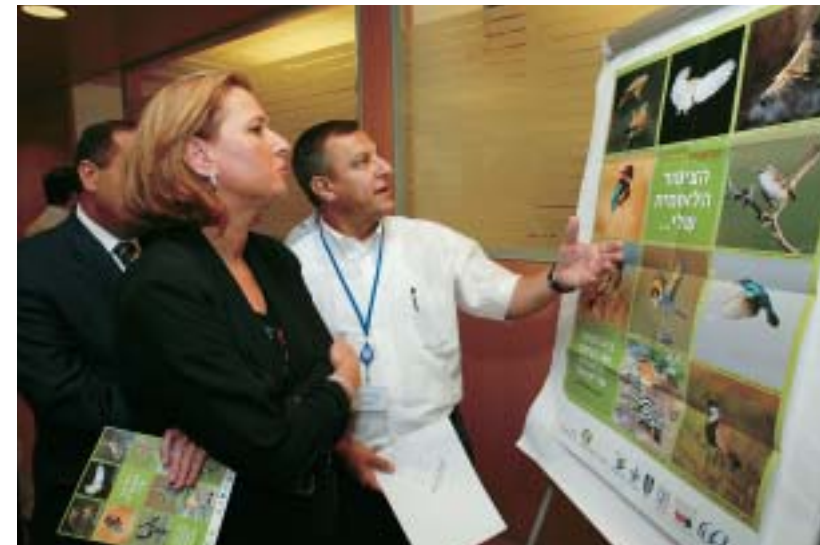
סגנית ראש הממשלה ושרת החוץ, הגב' ציפי לבני, בחרת בקלפי במשרד החוץ. 40 נציגויות ברחבי העולם השתתפו בבחירה.