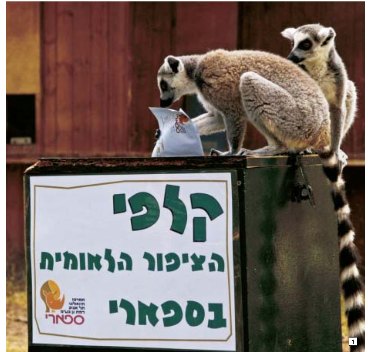
1. במשך חודש ניסן התקיימו בכל סופשבוע בחירות בספארי ברמת גן. גם הלמורים לקחו חלק פעיל בהצבעה. 2-3. כל מערכת החינוך התגייסה לבחירת הציפור הלאומית, בליווי פעילויות שונות. בתמונה: תלמידים משלמים את בחירתם לקלפי.